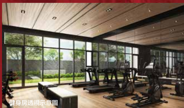
健身房透視示意圖